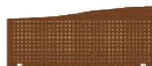
Séparateur forme Vague