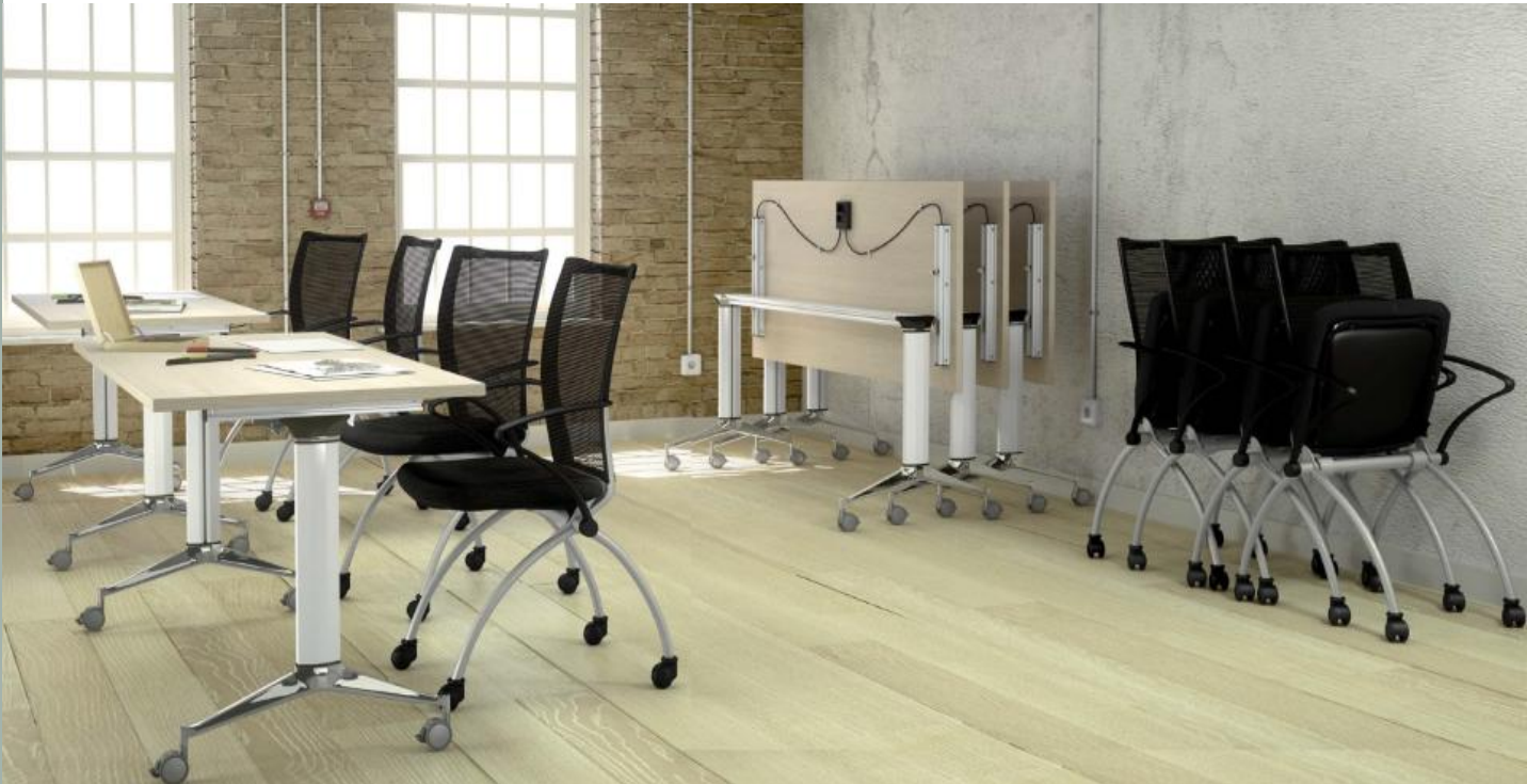
Table à plateau abattant

La table polyvalente NET permet de multiples combinaisons grâce à ses formes et sa mobilité.