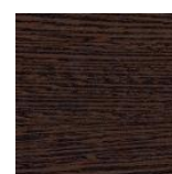
Wengué Chant noir