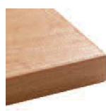
Hêtre Chant hêtre ou chant noir