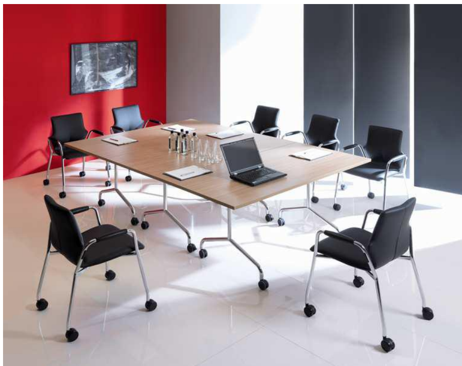
Table abattante FLIBUSTE