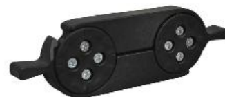
Kit de connexion optionnel