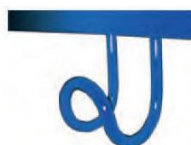
Option crochet porte-cartable