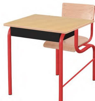
Modèle monoplace : L70 cm

ALICE est une table scolaire attenante (ensemble de table et chaise solidaires) en structure 4 pieds, plateau mélaminé ou stratifié.