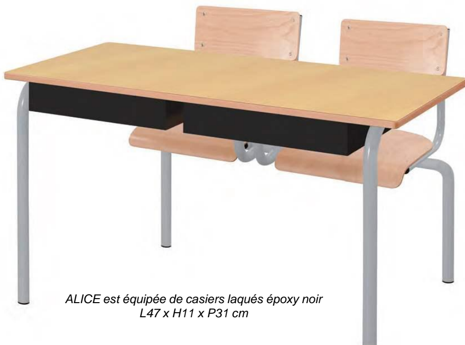
ALICE est équipée de casiers laqués époxy noir L47 x H11 x P31 cm