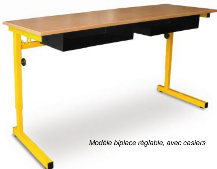
Modèle biplace réglable, avec casiers

LUIS est une table scolaire à dégagement latéral, plateau mélaminé ou stratifié. Fixe (taille 4, 5, 6 ou 7) ou réglable (taille 4 à 6), monoplace (L70 cm) ou biplace (L130 cm), LUIS peut être également équipée de casiers et/ou de crochet porte-cartable.