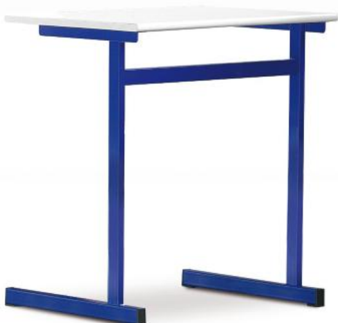
Modèle monoplace fixe