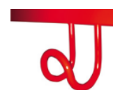
Option crochet porte-cartable