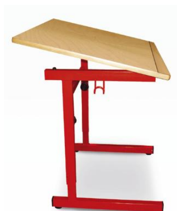
Modèle PMR réglable, avec crochet porte-cartable

Pour compléter votre équipement, LUIS dispose d'une version à plateau inclinable pour PMR (personne à mobilité réduite).