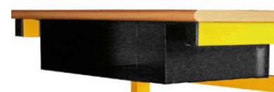
Option casier laqué noir