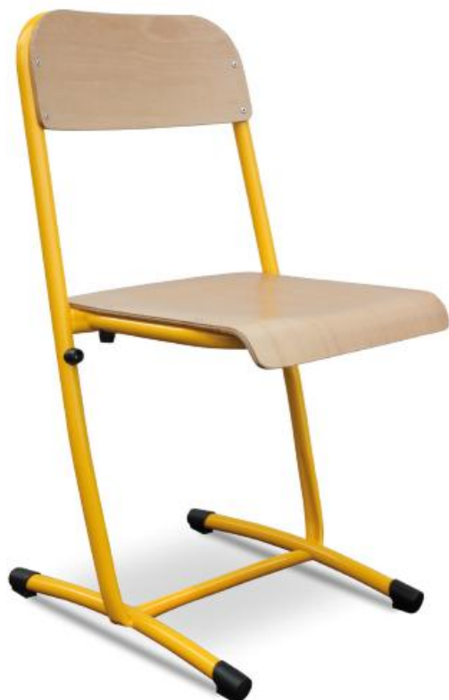
Assise et dossier en applique