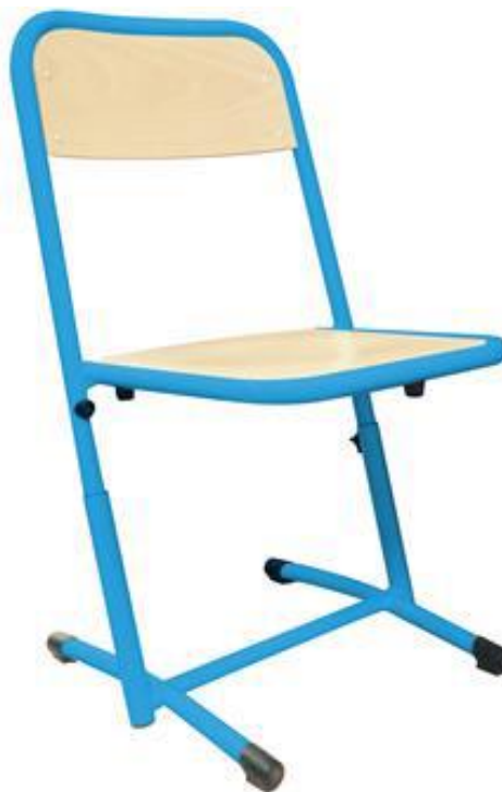
Assise et dossier encastrés