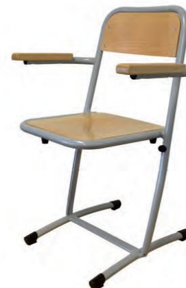
Version avec accoudoirs, pour le professeur

VERO est une chaise en appui sur table : très pratique pour les équipes d'entretien !