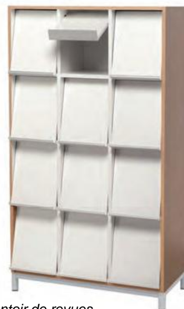
Présentoir de revues périodiques, volets pivotants ouvrant sur une réserve