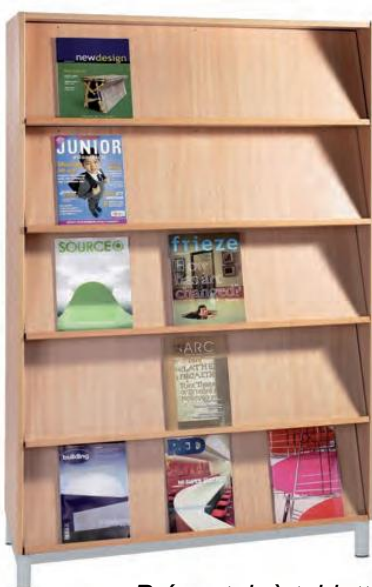
Présentoir à tablettes inclinées fixes

La largeur du nuancier vous permettra d'harmoniser votre ensemble de bibliothèque avec les tables et chaises.