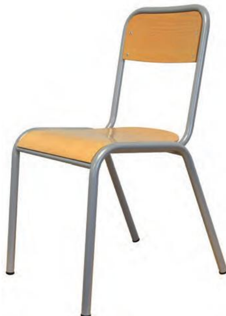
Chaise MELANIE, assise et dossier encastrés