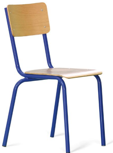
Chaise JULIAN, assise et dossier en applique