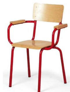
Modèles avec accoudoirs