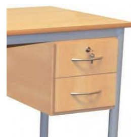
Caisson 2 tiroirs avec serrure

MICHEL est une chaire de professeur que vous pourrez configurer en fonction de vos besoins, à l'aide des 4 options de rangement, qui seront placées indifféremment à droite ou à gauche.