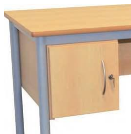
Caisson à porte avec serrure