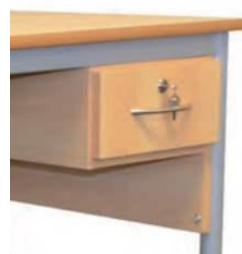
Caisson 1 tiroir avec serrure