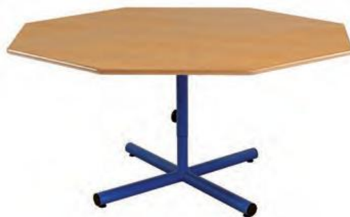
Piètement dégagement latéral, fixe ou réglable