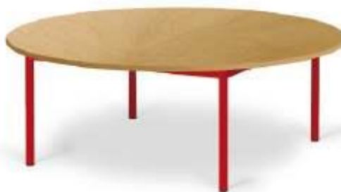
Piètement 4 pieds soudés