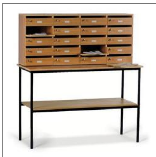
Option : Socle métallique haut Hauteur 90 cm x Prof.60 cm Avec étagère intermédiaire

La largeur du nuancier vous permettra de les harmoniser avec votre mobilier.