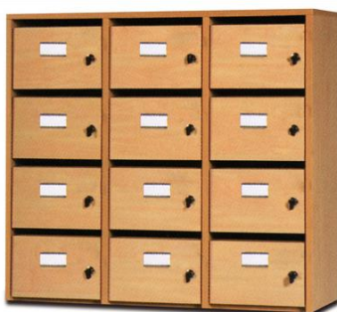
12 cases H80 x L91 x P40 cm