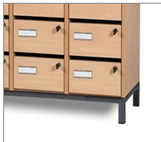
Option : Socle métallique bas Hauteur 10 cm