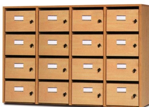
16 cases H80 x L120 x P40 cm

Dimensions utiles par case: H14,20 x L27,10 x P36,20 cm