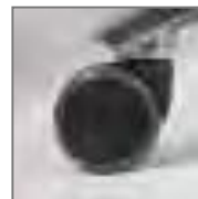
Roulettes pour sol souple ou sol dur