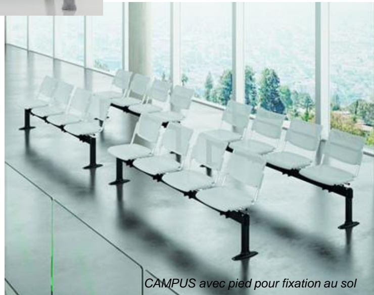
CAMPUS avec pied pour fixation au sol