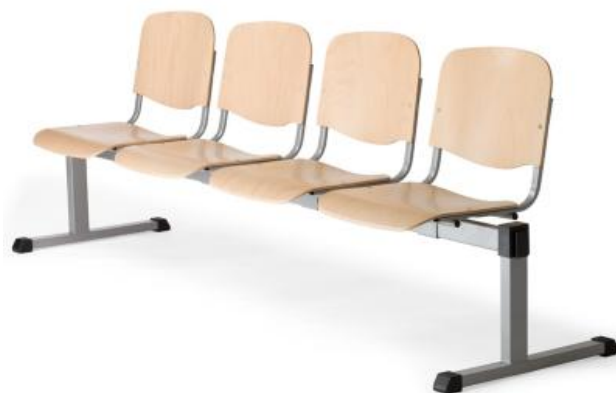
Également en sièges bois

La reine des espaces d'attente : sièges rembourrés, tapissés en tissu ou similicuir, ou sièges bois.