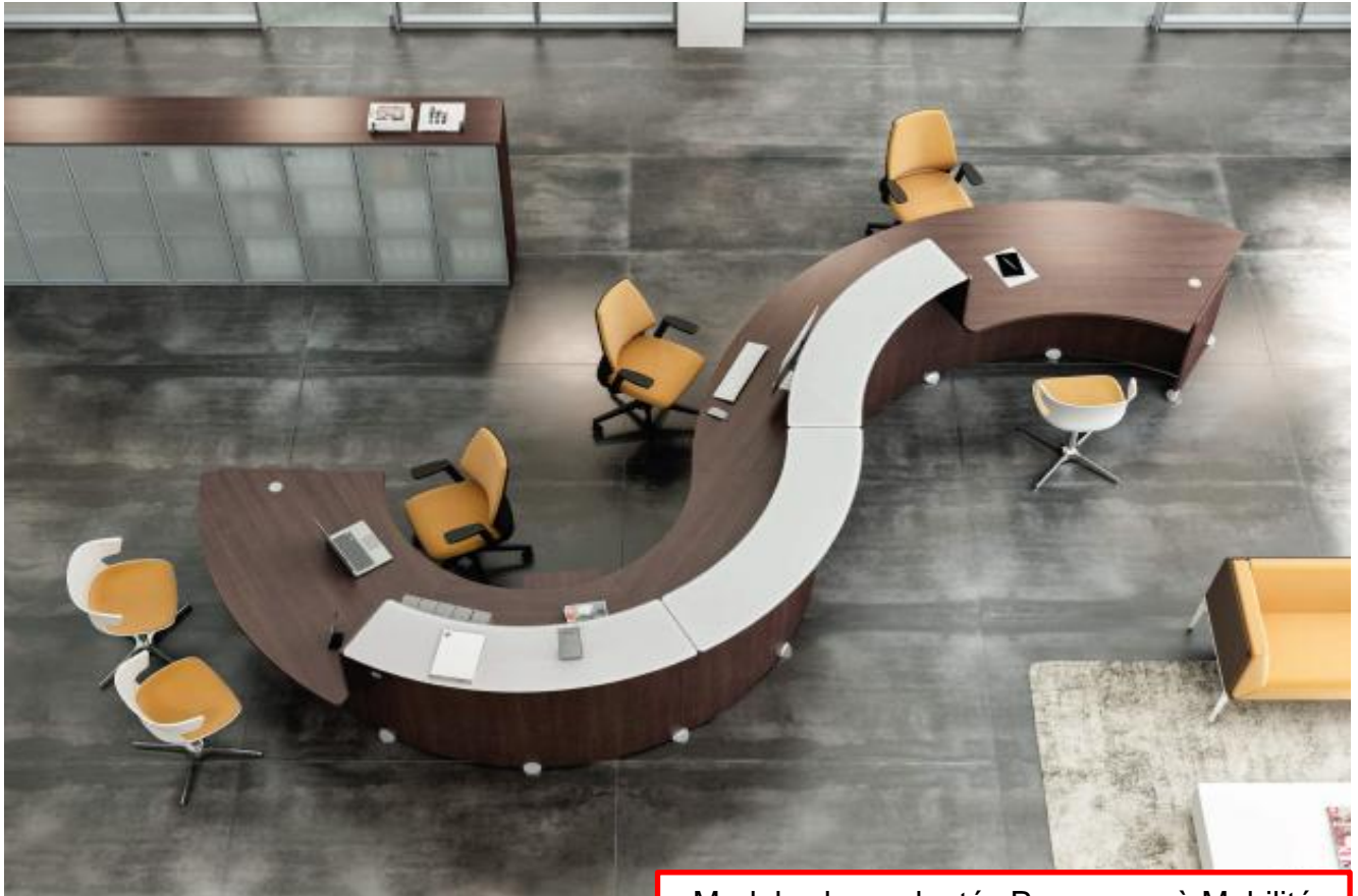
Banque Wengué avec accueil PMR

Modules bas adaptés Personnes à Mobilité Réduite (PMR), conformément à la législation européenne.