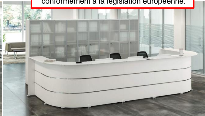
Banque blanche avec déco petites bandes (option)