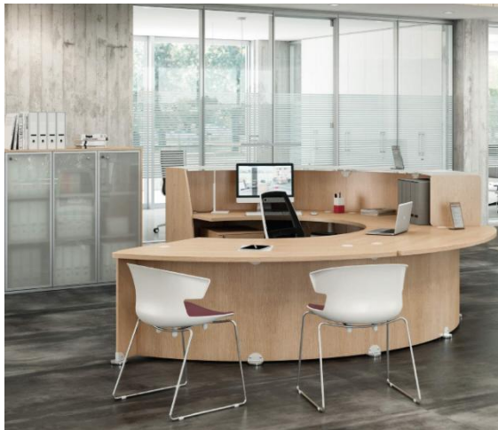
Banque Chêne avec accueil PMR

Modules bas adaptés Personnes à Mobilité Réduite (PMR), conformément à la législation européenne.